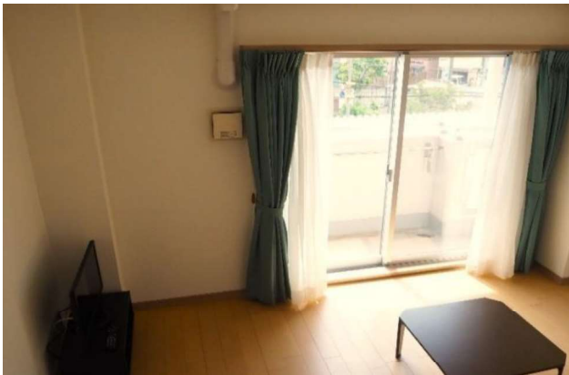
第2棟単身用居室。冷蔵庫などの家電も新調し、好評をいただいています！

くことができ、それをきっかけに飲酒を控えてくれました。その後、無事退所し「幸せに暮らしています」と連絡をくれた時は嬉しかったです。