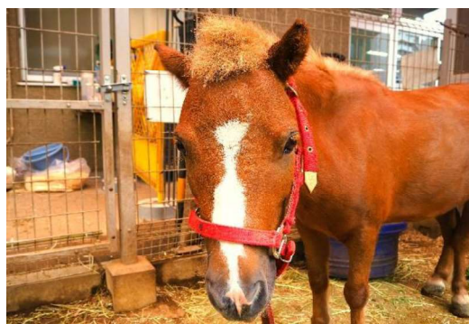
ミニチュアホースのくりまめ君。脱走のニュースで一躍有名に。

そのためにはアセスメントから始まり、生活歴をうかがう事もあります。ただ、やはりアセスメントが大切です。アセスメントの中で、目標に対する課題と地域移行に活用できる強みの両方を発見して、どのような社会資源を活用できるのかを考えていく必要があります。